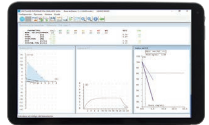
Apto para tablet con Windows 10