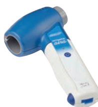
DATOSPIR aira FLEISCH