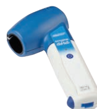
DATOSPIR aira TURBINA